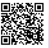
学習支援コンテンツ