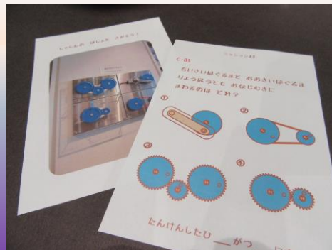
ミッションカード

展示装置に関する課題が書かれている ミッションカードを手に入れて、科学 展示室内を探検しよう！ 実際に展示装置を操作したり観察したり することで答えがわかったらミッション クリア！スタンプをもらおう！ 毎週土曜日11:30より開催 (ミッションカードがなくなり次第終了)