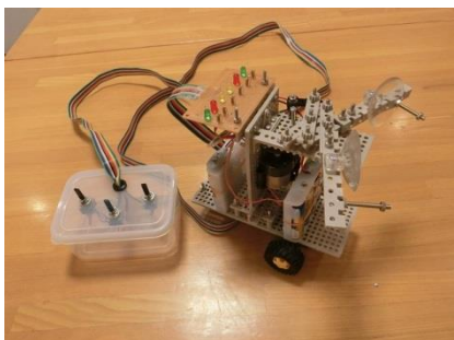
キャリアロボットの作成例

今年度からロボット大会が変わります！ 3月23日(土)にロボビンゴSPを開催予定！