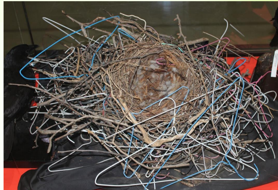
りょうす ハンガーを利用したカラスの巣