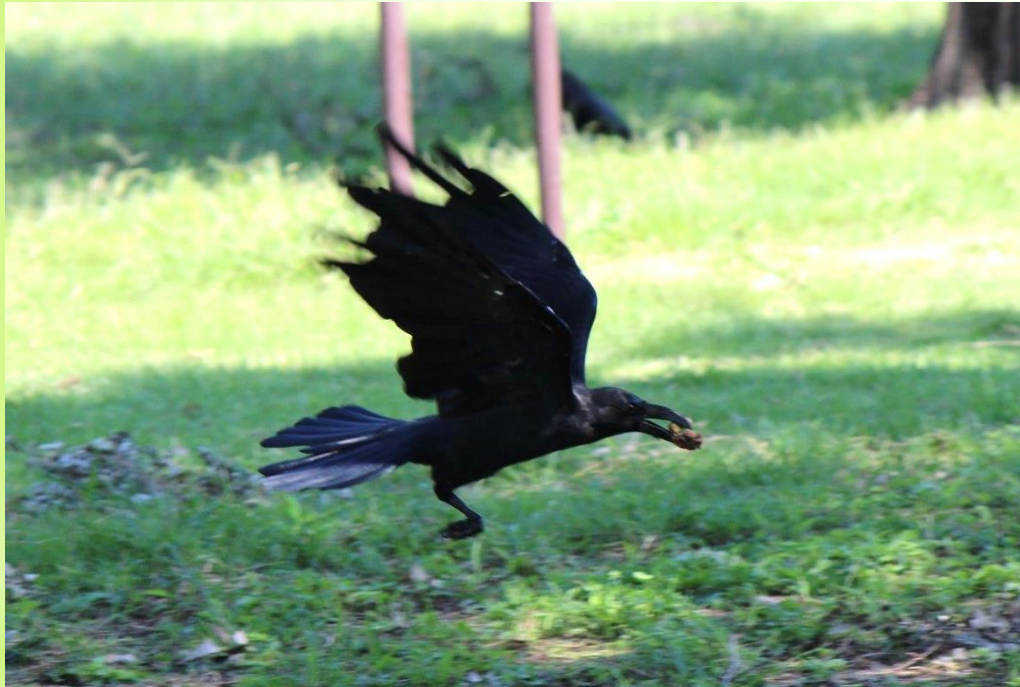
き み 木の实をくわえるハシボソガラス