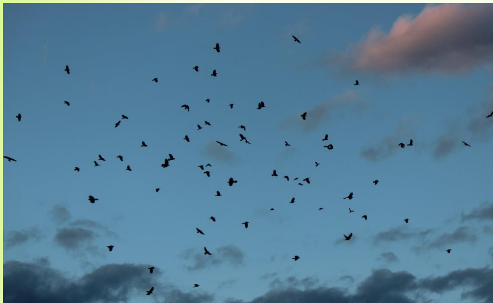
いどう ねぐらに移動するカラスたち