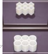
鏡で見ると形が変わる！

〔開催期間〕12月9日(土)～2月12日(月・祝) 〔料金〕科学展示入場料 一般200円、小中学生100円